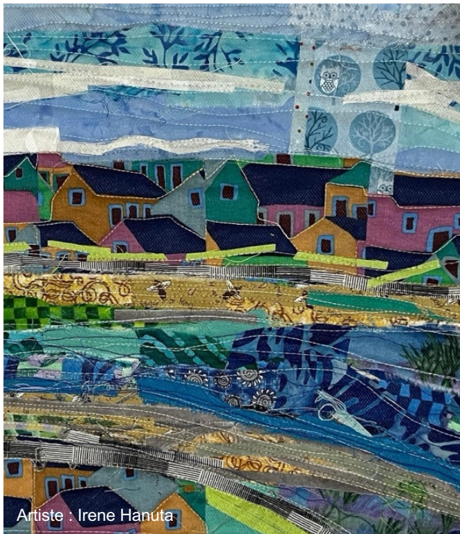
Artiste : Irene Hanuta

À l'heure actuelle, l'équipe du POTCRG étudie la logistique de la réalisation d'une œuvre de théâtre ambulante destinée à parcourir 310 kilomètres le long de la rivière ainsi que de la récolte des fonds nécessaires pour y parvenir. Pour l'instant, elle a largement compté sur l'aide de bénévoles. Les personnes qui ont contribué aux prologues nous ont fait don de leur temps et de leurs efforts lors de chaque représentation. Les espaces où ont lieu les cercles de partage et autres activités créatives nous sont prêtés par les communautés de la rivière Grand pour soutenir l'initiative. Le POTCRG est allé chercher une personne expérimentée en collecte de fonds afin de trouver des sources de revenus stables pour l'avenir du projet. Depuis, nous avons présenté des demandes de financement auprès du Conseil des arts du Canada, de la Fondation Trillium de l'Ontario et du Conseil des arts de l'Ontario, tout en cherchant de nouvelles façons innovantes de lever des fonds pour le projet.